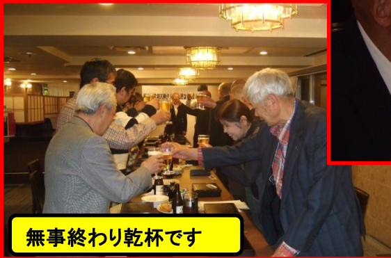
無事終わり乾杯です